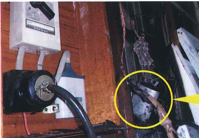
※絶縁破壊をおこした低圧進相コンデンサ

若狭消防組合管内で、古い低圧進相コンデンサの発火が原因とみられる建物火災が発生しました。